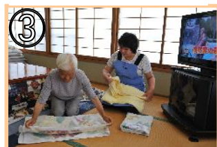
③ 一緒に洗濯物をたたむ