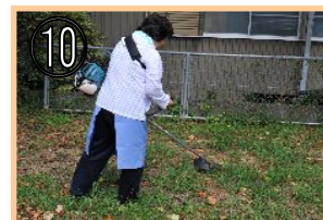
⑩ 草刈りや庭の草抜き