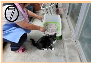
⑦ ペットの買い物及び世話