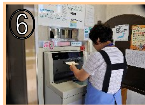
⑥ 金融機関でのお金の取扱い及び支払い等