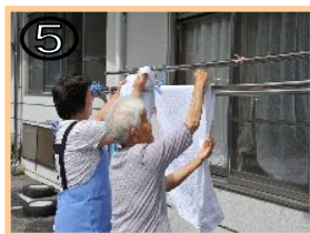
⑤ 一緒に洗濯物を干す