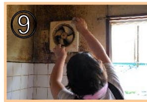
⑨ 換気扇を取り外すなどの大掃除