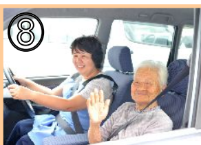
⑧ 社協ヘルパーの車への同乗