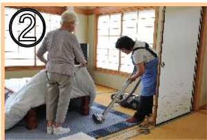
② 一緒に掃除をする